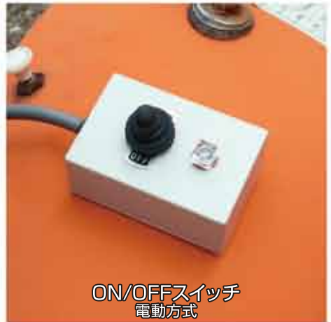
ON/OFFスイッチ 電動方式