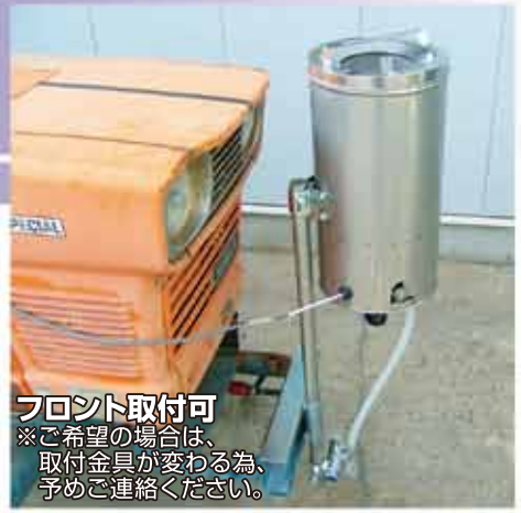
フロント取付可 ※ご希望の場合は、 取付金具が変わる為、 予めご連絡ください。