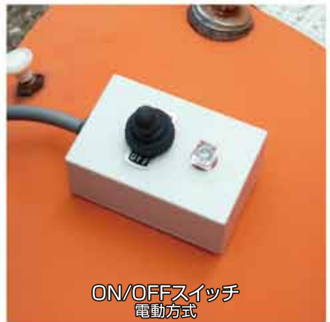
ON/OFFスイッチ 電動方式