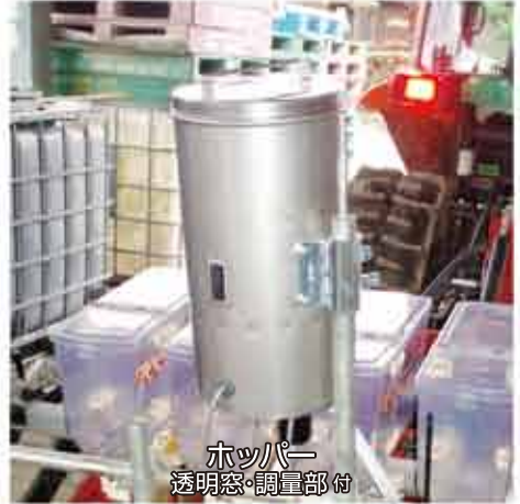
ホッパー 透明窓・調量部付