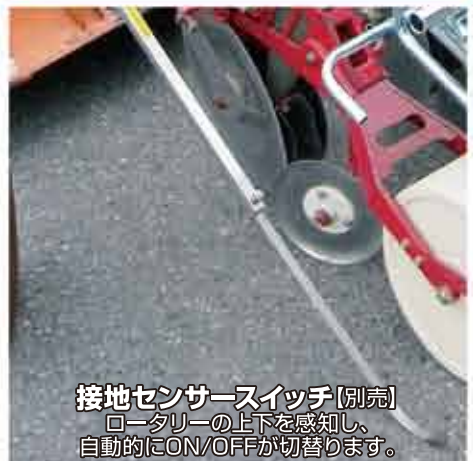
接地センサースイッチ【別売】 ロータリーの上下を感知し、 自動的にON/OFFが切替ります。