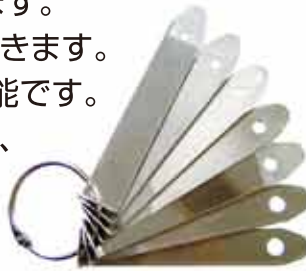
調量板 全7種類(穴径4.0~7.0mm)