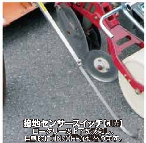
接地センサースイッチ[別売] ロータリーの上下を感知し、 自動的にON/OFFが切替ります。