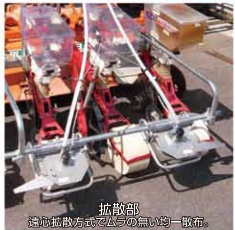
拡散部 遠心拡散方式でムラの無い均一散布。