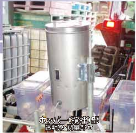
ホッパー(攪拌部) 透明窓・調量部付