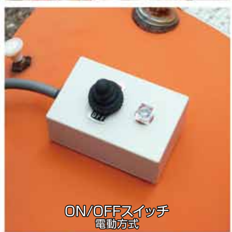
ON/OFFスイッチ 電動方式