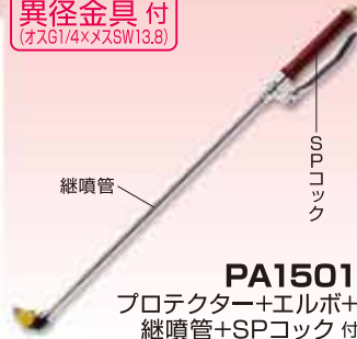
PA1501 プロテクター+エルボ+ 継噴管+SPコック付