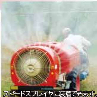
スピードスプレーヤに装着できます。