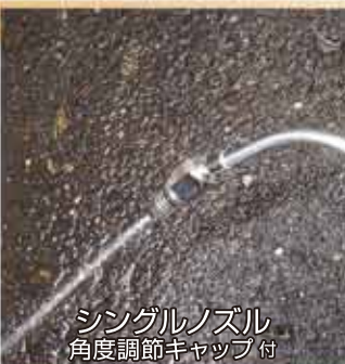
シングルノズル 角度調節キャップ付