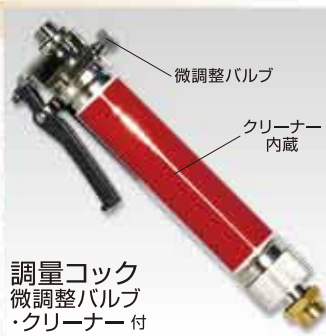
調量コック 微調整バルブ ・クリーナー付