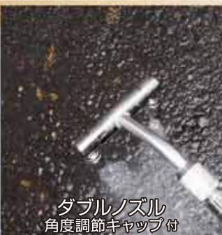
ダブルノズル 角度調節キャップ付