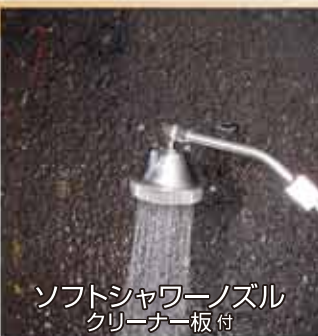
ソフトシャワーノズル クリーナー板付