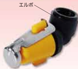
PA15PB プロテクター+エルボ付