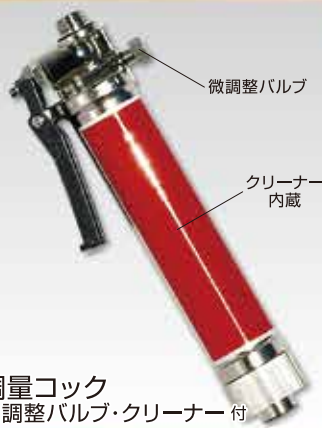
調整コック 微調整バルブ・クリーナー付