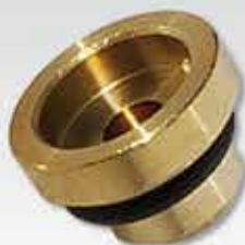
減圧板 (散布圧力抑制板)