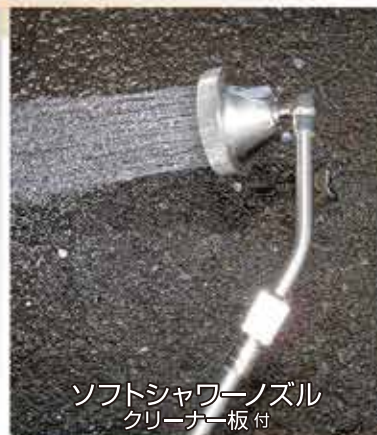
ソフトシャワーノズル クリーナー板付