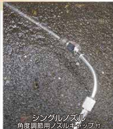
シングルノズル 角度調節用ノズルキャップ付