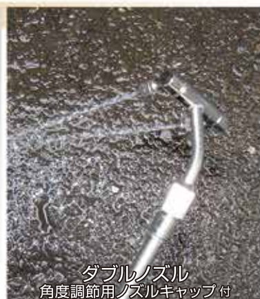
ダブルノズル 角度調節用ノズルキャップ付