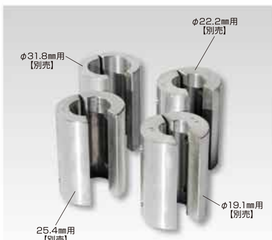
スペーサー(クランプ部用)【別売】

ハウスの支柱 パイプや単管 パイプを地面 へ打込むのに 最適な人力用 ハンマーです。