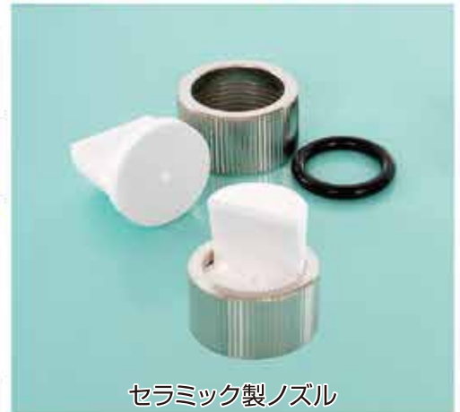
セラミック製ノズル