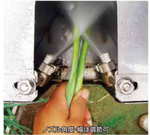
ノズル角度・幅は調節可